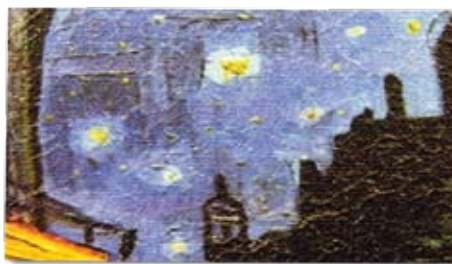
Particolare di Texture Coat