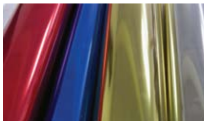
Oro, argento, rosso e blu